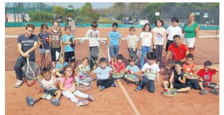
Les petits de l'école de tennis ont repris le chemin des courts.